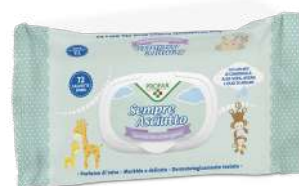
SEMPRE ASCIUTTO 72 salviette detergenti