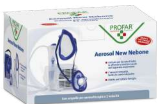
AEROSOL New Nebone