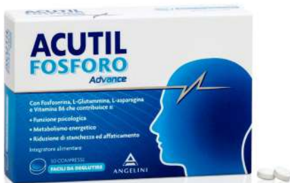
ACUTIL • Fosforo Advance 50 compresse • Fosforo Advance 10 flaconcini • Donna 20 compresse