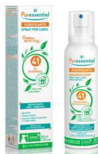
PURESENTIEL PURIFICANTE SPRAY PER L'ARIA 41 OLI ESSENZIALI 200 ml