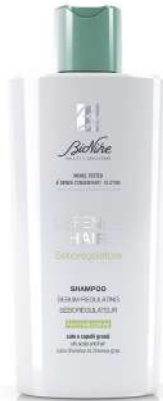
DEFENCE HAIR SHAMPOO SEBOREGOLATORE NORMALIZZANTE 200 ml