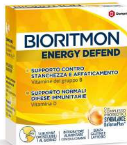
BIORITMON ENERGY DEFEND 14 bustine orosolubili