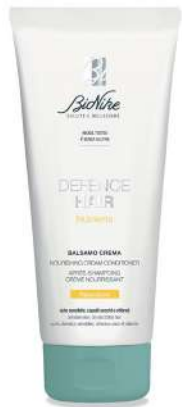
DEFENCE HAIR BALSAMO CREMA NUTRIENTE 200 ml