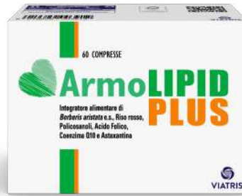
ARMOLIPID PLUS 60 compresse