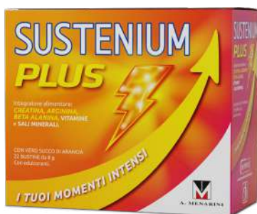
SUSTENIUM PLUS 22 bustine da 8 g