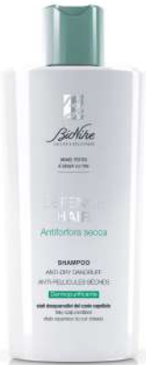
DEFENCE HAIR SHAMPOO ANTIFORFORA SECCA DERMPURIFICANTE 200 ml