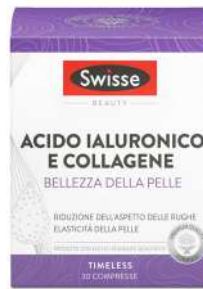
SWISSE BELLEZZA DELLA PELLE 30 compresse