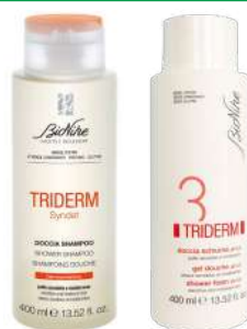
TRIDERM • Doccia shampoo 400 ml • Doccia schiuma 400 ml