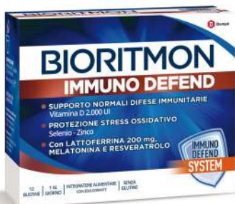
BIORITMON IMMUNO DEFEND 12 bustine