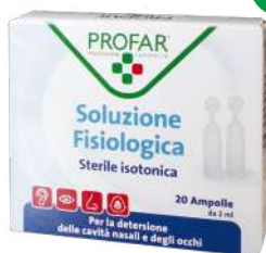
SOLUZIONE FISIOLGICA ISOTONICA 20 ampolle da 2 ml