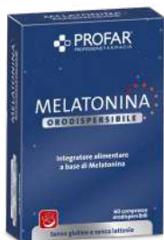
MELATONINA ORODISPERSIBILE 60 compresse

CONTINUANO LE PROMOZIONI DI MARZO VALIDE FINO AL 30 APRILE 2024