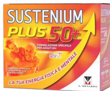
SUSTENIUM PLUS 50+ 16 bustine da 4,5 g