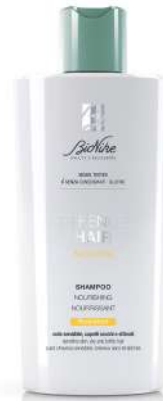
DEFENCE HAIR SHAMPOO NUTRIENTE RIPARATORE 200 ml