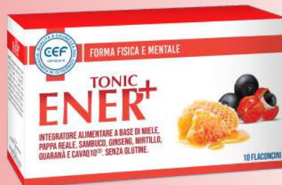
ENER+ TONIC 10 flaconcini