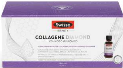
SWISSE COLLAGENE DIAMOND 10 flaconcini 30 ml