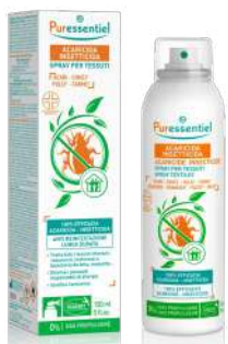
PURESENTIEL ACARICIDA INSETTICIDA SPRAY PER TESSUTI 150 ml