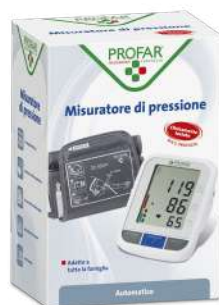
MISURATORE DI PRESSIONE